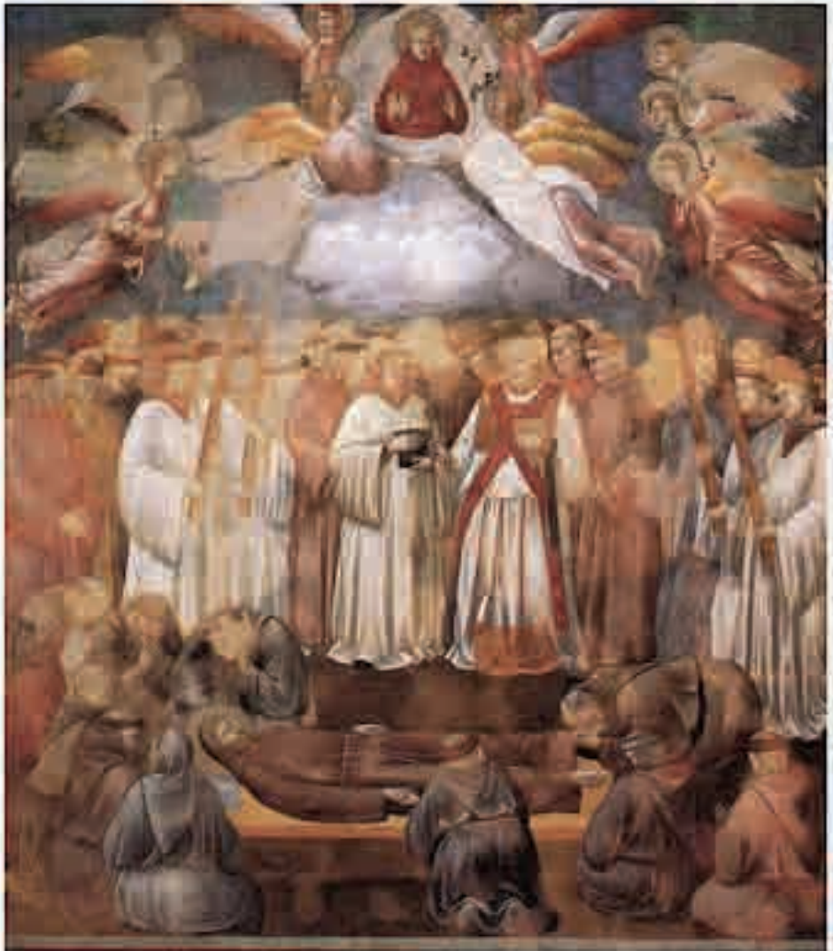
Giotto, La morte di Francesco, Assisi 1290/95