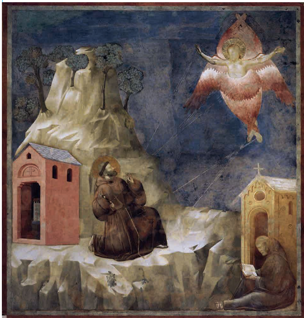
Giotto, Francesco riceve le stimmate a Laverna, Assisi 1290/95