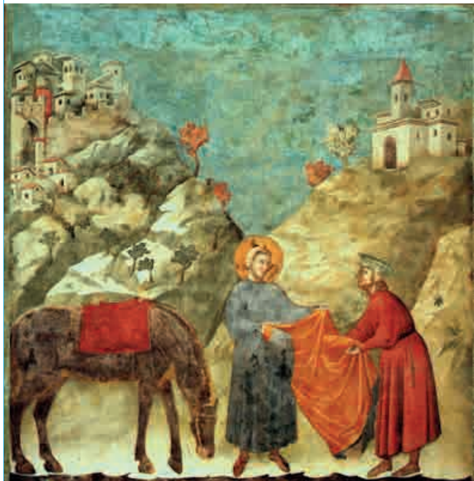
Giotto, Francesco dona un mantello ad un cavaliere, Assisi 1290/95