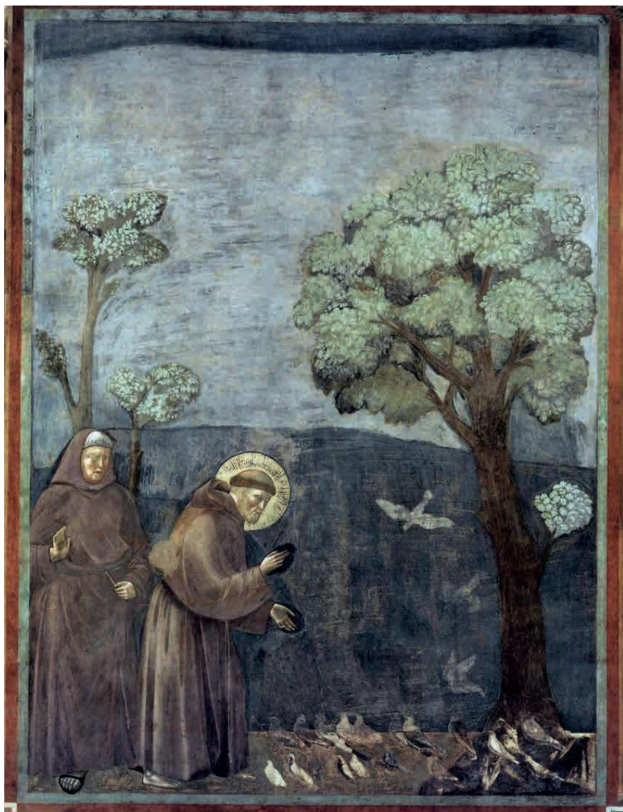
Giotto, Francesco predica agli uccelli, Assisi 1290/95