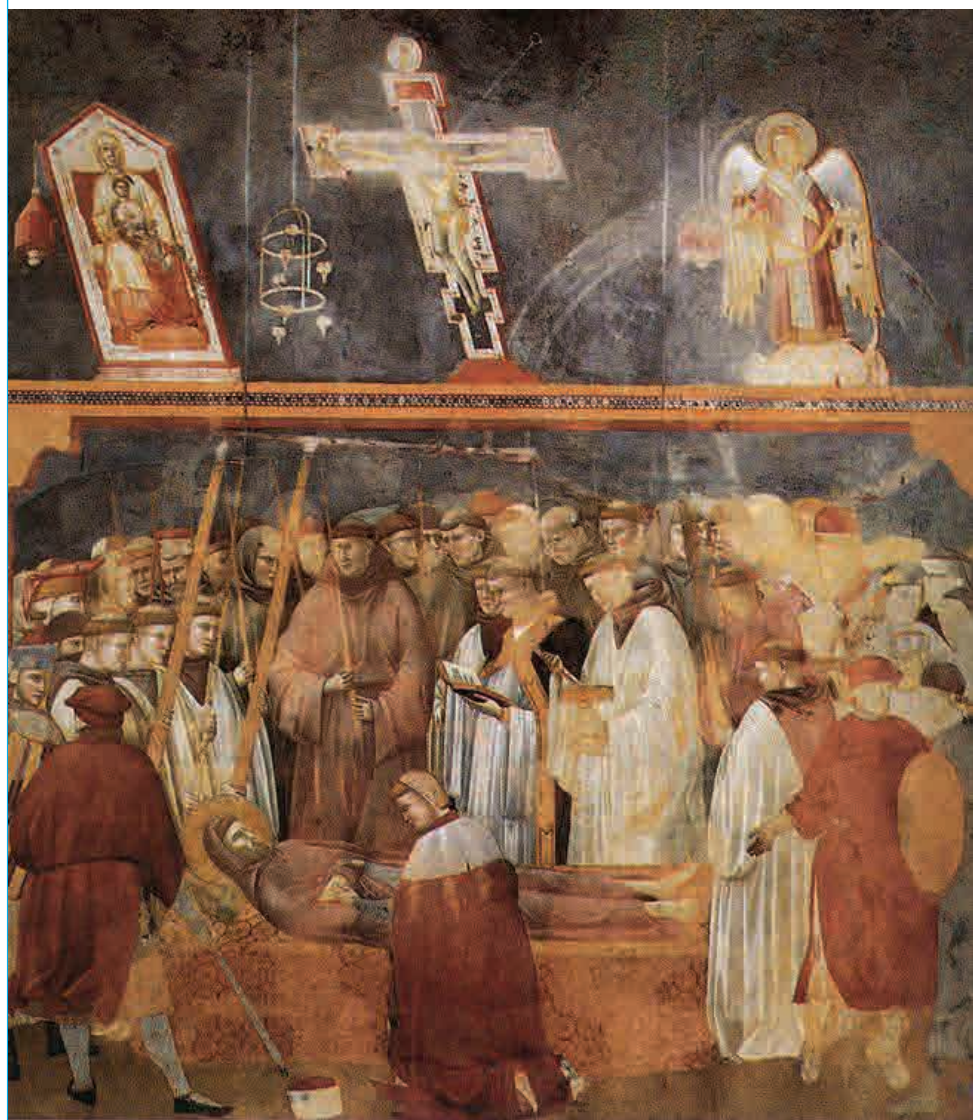
Giotto, Il patrizio Girolamo accerta le stimmate di Francesco, Assisi 1290/95