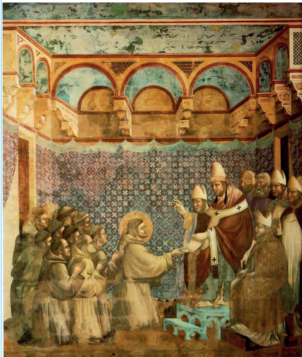
Giotto, Innocenzo III accoglie Francesco e approva la regola, Assisi 1290/95