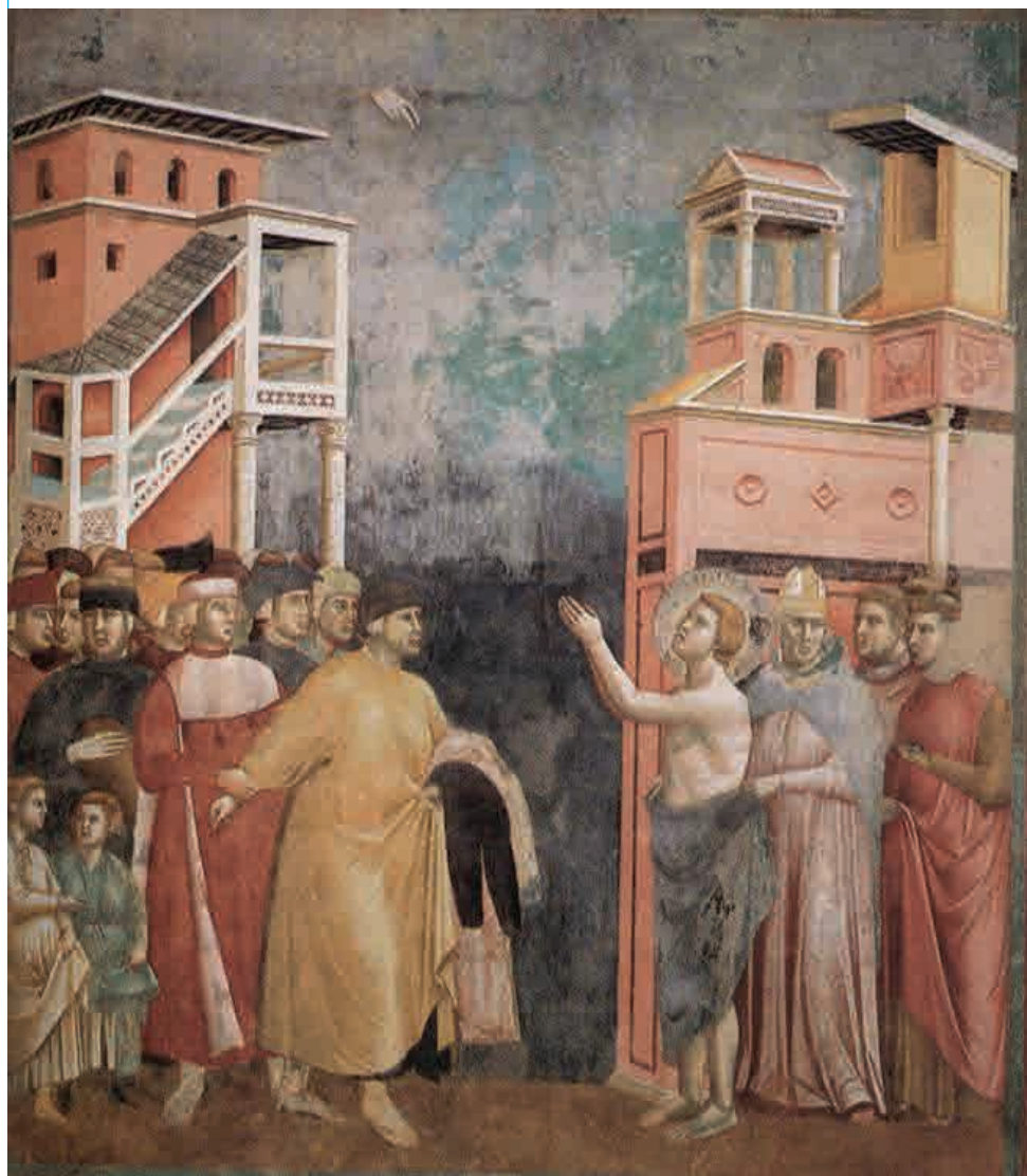
Giotto, Francesco rinuncia ai suoi beni, Assisi 1290/95