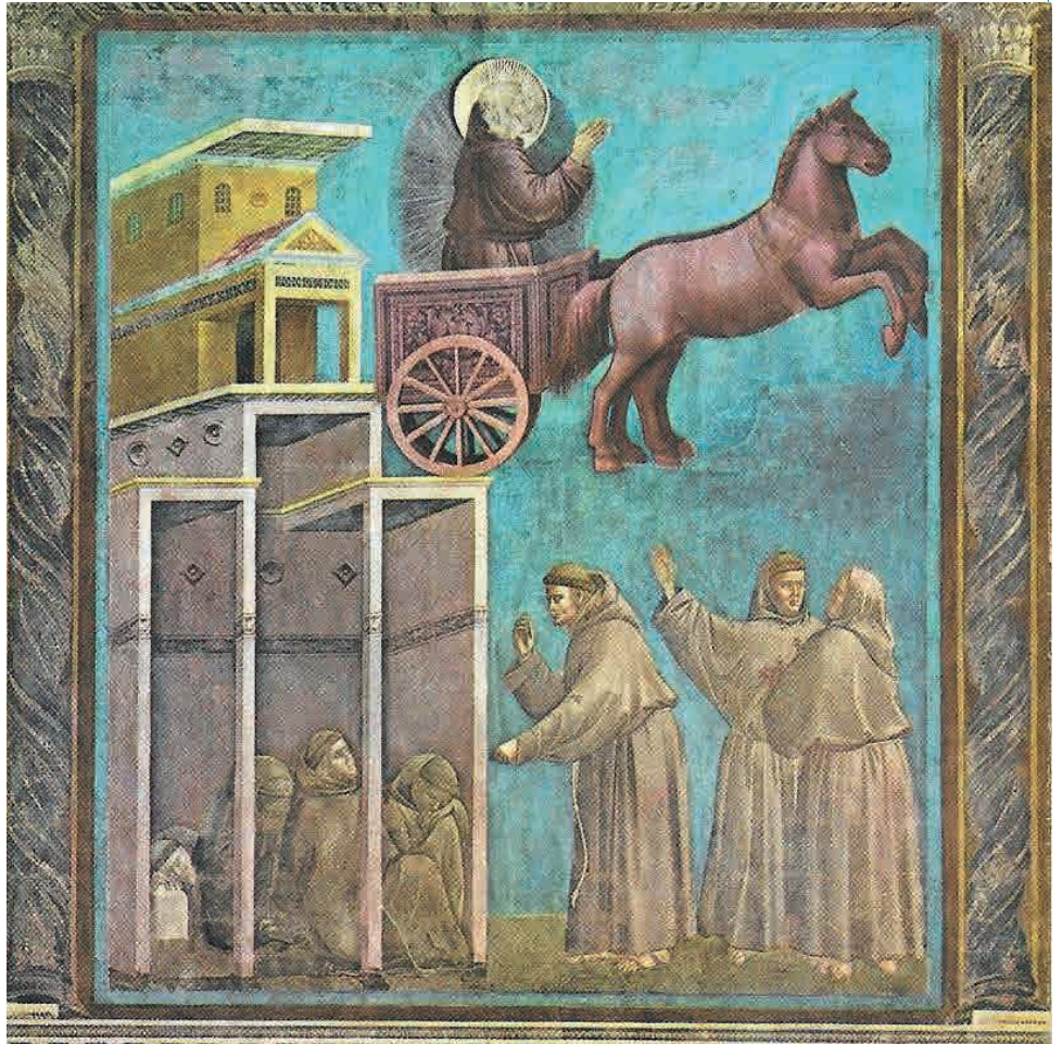
Giotto, Francesco e rapito in estasi a Rivotorto, Assisi 1290/95