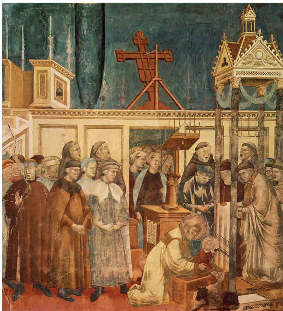
Giotto, Francesco e il presepe di Greccio, Assisi 1290/95