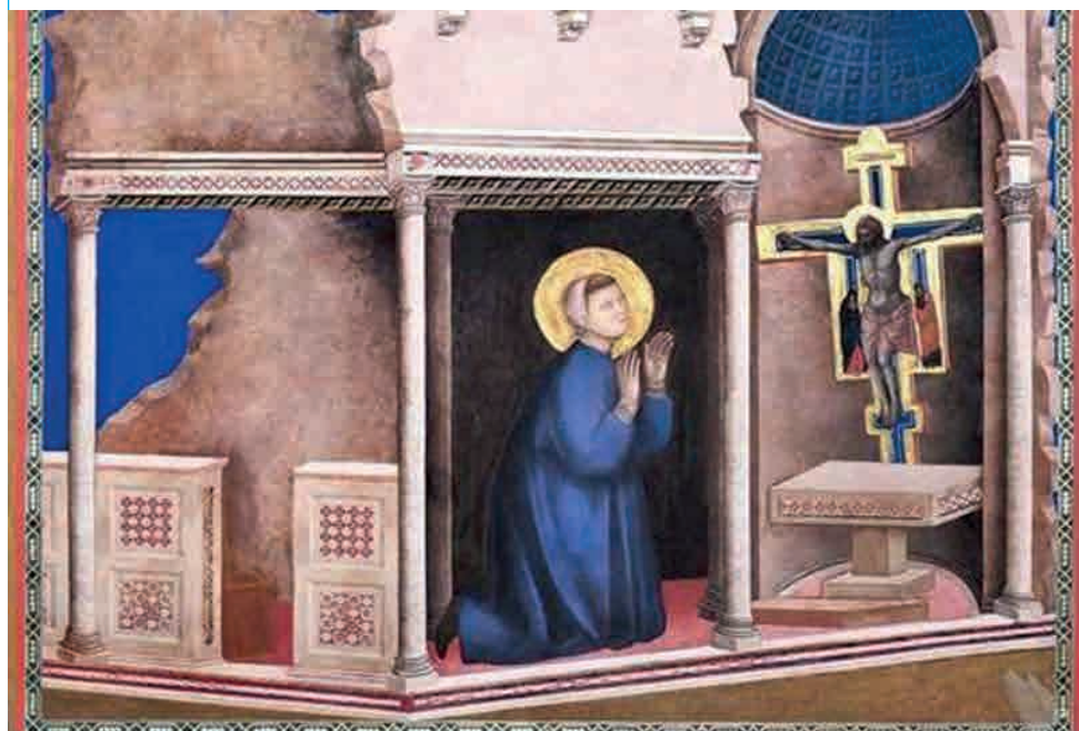
Giotto, Francesco incontra il Cristo di San Damiano, Assisi 1290/95