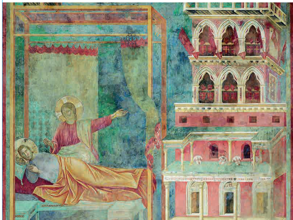
Giotto, Sogno di Francesco nel servire il padrone o il servo, Assisi 1290/95