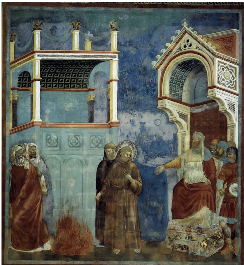
Giotto, Francesco e il sultano in Egitto, Assisi 1290/95