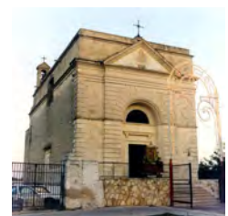
la cappella del Pozzo