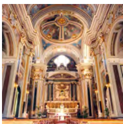
Interno della Basilica

Ore 16,30 – Cappella del Pozzo, visita e Celebrazione della Santa Messa