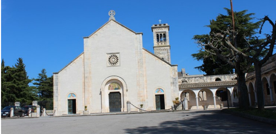
La facciata dell'Abbazia in stile romanico - Monastero Padri Benedettini - Noci