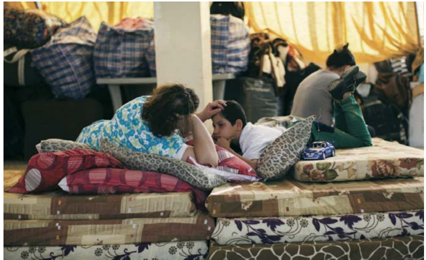
Con l'aiuto dell'Ordine, il Patriarcato Latino di Gerusalemme ha fornito aiuti umanitari a più di 11.000 famiglie irachene sfollate.

Inoltre, il Patriarcato Latino ha ospitato le 220 famiglie irachene che vivevano nelle