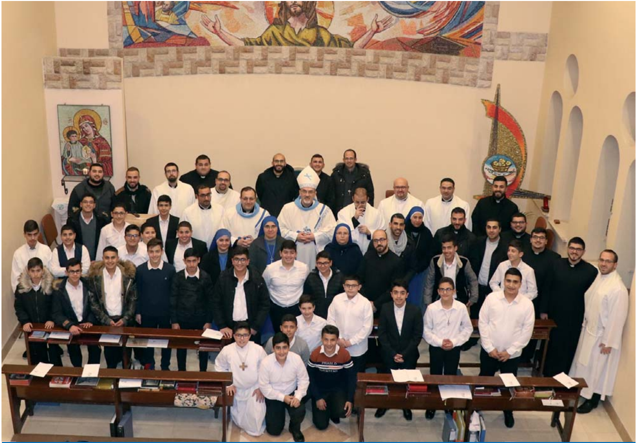
Mons. Pierbattista Pizzaballa con i seminaristi della sua diocesi e i loro formatori nel seminario di Beit Jala, in Palestina.

storale e un anno finale per l'ordinazione diaconale e sacerdotale.