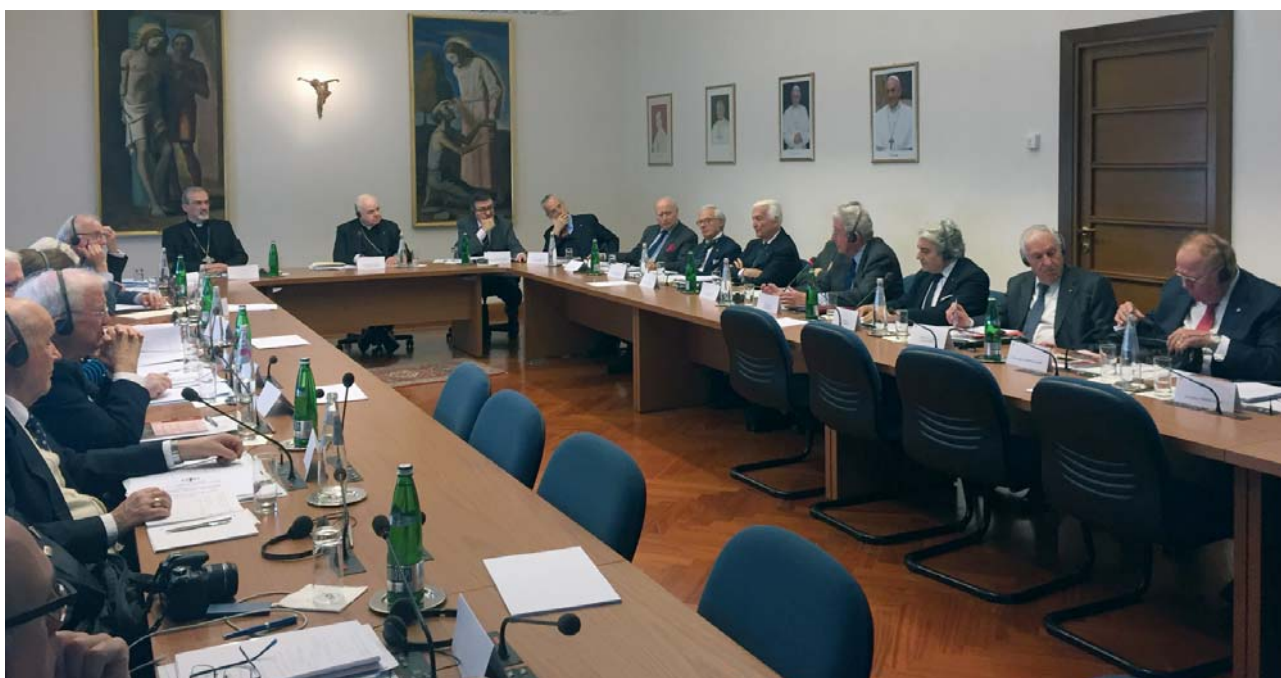
I membri del Gran Magistero in riunione insieme al cardinale Edwin O'Brien.