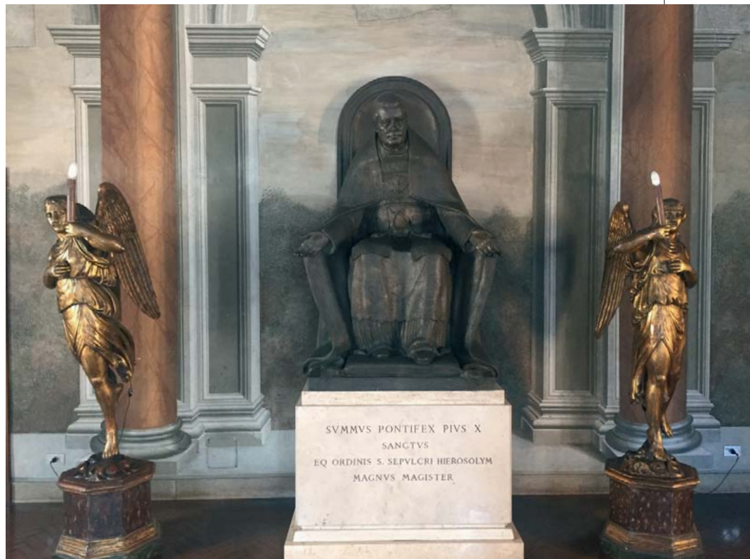
La statua di San Pio X presiede le grandi riunioni continentali e internazionali organizzate dal Gran Magistero, al Palazzo della Rovere, a pochi metri da piazza San Pietro.

la fede. Morto il 20 agosto 1914, pochi giorni dopo lo scoppio della prima guerra mondiale, è attualmente l'unico santo canonizzato appartenuto all'Ordine del Santo Sepolcro, di cui è stato Gran Maestro. Per consolidare la posizione dell'Ordine in Terra Santa, San Pio X riservò per lui e per i suoi successori la carica di Gran Maestro con la lettera apostolica Quam multa del 13 ottobre 1908, e concesse ai Cavalieri un posto nelle cappelle papali, mentre il Patriarca Latino di Gerusalemme venne designato Rettore e amministratore perpetuo dell'Ordine.