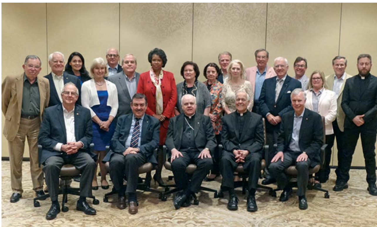
I partecipanti all'incontro dei Luogotenenti nordamericani a Houston.

dedicata nel successivo dibattito agli aspetti gestionali e finanziari e a quelli della comunicazione.